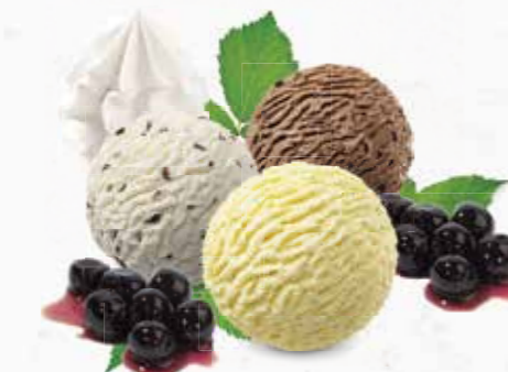
Coupe Schwarzwald Vanille-, Stracciatella- und Schokoladen-Rahmglace mit Kirschen und Rahm CHF 12.80