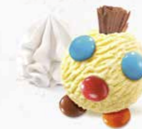
Coupe Smarties mit 1 Kugel nach Wahl und Smarties CHF 6.00