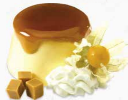
Mamas hausgemachtes Caramel - Köpfli mit Caramelsauce CHF 9.50