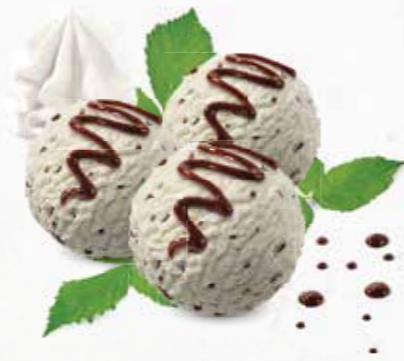
Coupe Temptation Stracciatella-Rahmglace mit Schokoladensauce und Rahm CHF 12.80