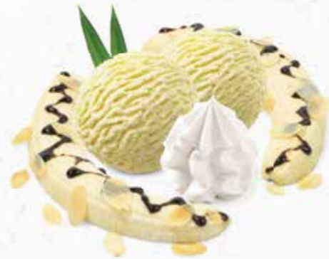
Banana Split Vanille-Rahmglace und Bananenhälften mit Schokoladensauce und Rahm CHF 12.80