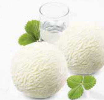
Sorbet Colonel Zitronensorbet mit Wodka CHF 13.80