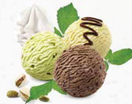
Coupe Palma Vanille-, Pistazien- und Schokoladen-Rahmglace mit Schokoladensauce und Rahm CHF 12.80