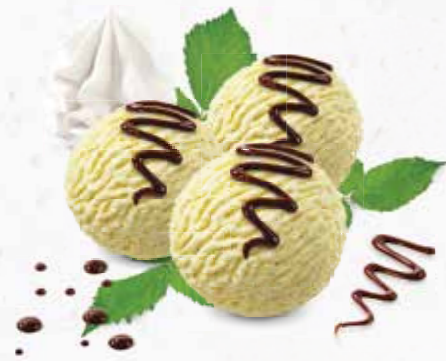
Coupe Danmark Vanille-Rahmglace mit Schokoladensauce und Rahm CHF 12.80