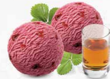
Zwetschgensorbet mit Vieille Prune CHF 13.80