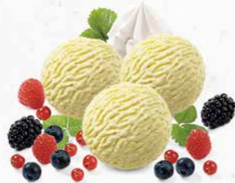
Coupe Hot Berry Vanille-Rahmglace mit heissen Waldbeeren und Rahm CHF 12.80