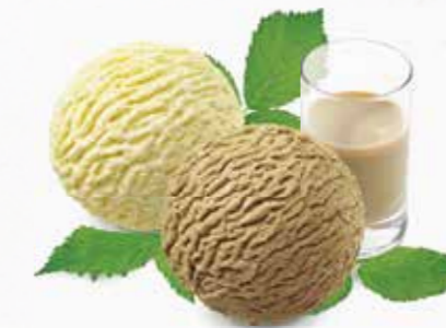
Coupe Baileys Vanille- und Café-Rahmglace mit Baileys und Rahm CHF 13.80