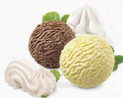
Meringues Glacées Vanille- und Schokoladen-Rahmglace mit Meringues und Rahm CHF 12.80 Meringue mit Rahm CHF 10.50