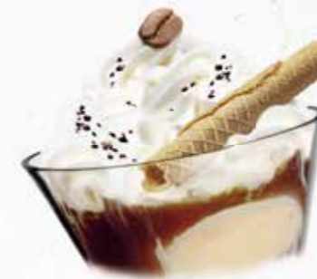
Coupe Ice Café Café-Rahmglace mit Moccasauce und Rahm CHF 11.80