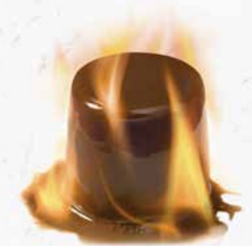
Parfait Mokka Mokka-Rahmglace flambiert mit Grand Marnier CHF 12.80