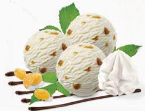
Coupe Jamaica Rhum-Raisins-Rahmglace mit Rahm und Schokoladensauce CHF 12.80