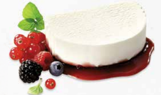
Panna Cotta CHF 10.80