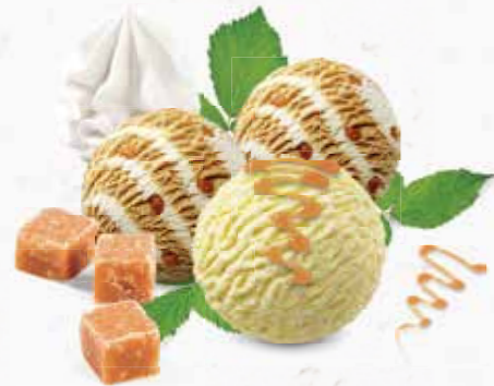
Coupe Alexandra Caramel und Vanille-Rahmglace mit Caramelsauce und Rahm CHF 12.80